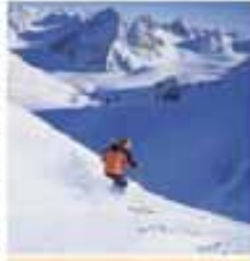
Im weitläufigen Skigebiet Pitztal

D ie Pitztal-Region ist ein traumhaftes Skigebiet, das sich über eine Fläche von ca. 1000 km 2 erstreckt. Die Pitztal-Region ist ein traumhaftes Skigebiet, das sich über eine Fläche von ca. 1000 km 2 erstreckt. Die Pitztal-Region ist ein traumhaftes Skigebiet, das sich über eine Fläche von ca. 1000 km 2 erstreckt.